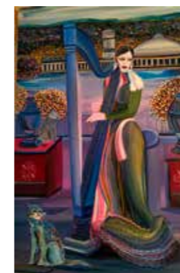
La mujer del arpa